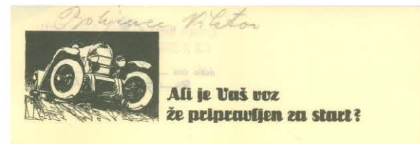
Reklamni letak za pnevmatike, 1934

Slovenija, 2017, barvni, 11' Produkcija Zgodovinski arhiv Ljubljana, realizacija Studio Virc Scenaristka Marjana Kos Režiserka Urška Djukić Direktor fotografije Rožle Bregar