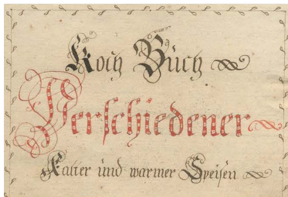
Kuharska knjiga, 1800 (Zgodovinski arhiv Ljubljana)