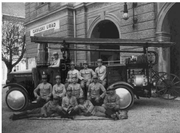
Poklicni gasilci ljubljanske mestne občine, ok. 1923