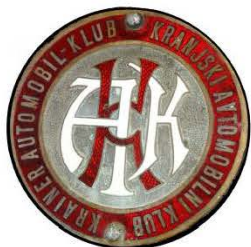
Značka Kranjskega avtomobilnega kluba - Krainer Automobil Klub, ok. 1910