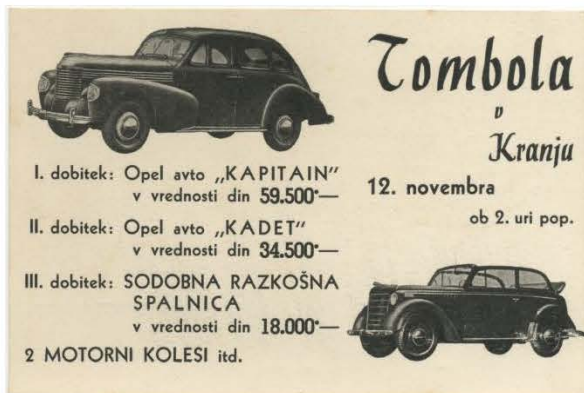
Letak za gasilsko tombolo v Kranju, 1931