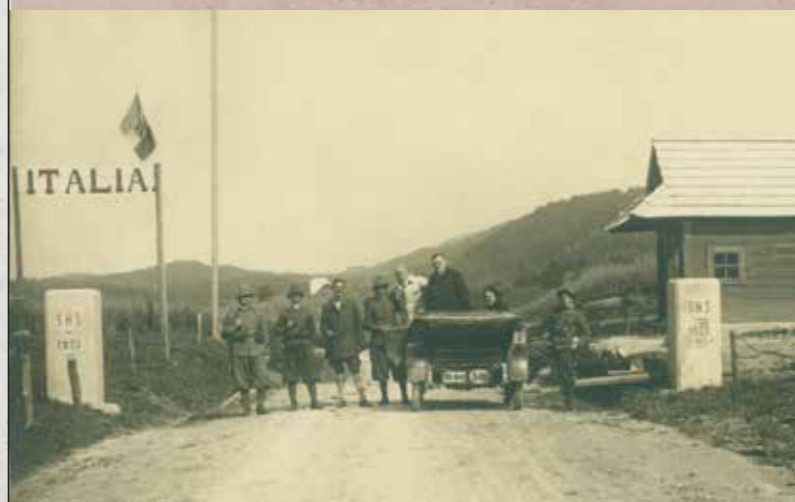
Mejni prehod med Kraljevino Srbov, Hrvatov in Slovencev in Kraljevino Italijo pri Hotedršici po podpisu Rapalske pogodbe (1920).

je poudarjala predvsem ekonomske prednosti in ohranitev enotnosti Celovške kotline. Avstrijska stran je po plebiscitu nadaljevala z raznarodovalno politiko, s katero so Koroškimi Slovincem začeli omejevati jezikovne pravice, ki so si jih izborili v Avstro-Ogrski. V letih po plebiscitu so nemški nacionalisti v več organizacijah izvajali pritiske na Slovence, ki so glasovali proti združitvi z Republiko Avstrijo, in sprožili val izseljevanja.