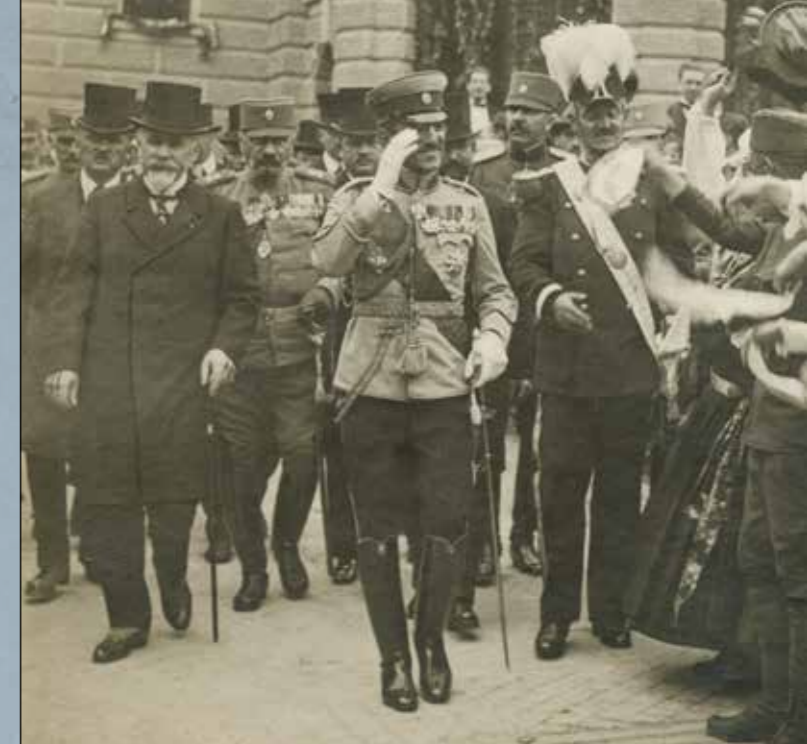
Junija 1920 je prestolonaslednik Aleksander prvič uradno obiskal Slovenijo. (SI_ZAL_LJU/0342, Zbirka fotografij, A5-075-043)

Spomladi 1918 je italijanska fronta začela razpadati , avstro-ogrsko vojsko sta preplavila nemir in nezadovoljstvo. Izbruhnili so spontani upori vojakov v zaledju, ki so bili krvavo zadušeni, avstro-ogrsko vojska, sestavljena pretežno iz vojakov nenemških narodov, pa je postala nezanesljiva. Poglobljala so se tudi politična nesoglasja v avstrijskem parlamentu in južni Slovani so postajali vse glasnejši v zahtevi po samostojnosti.