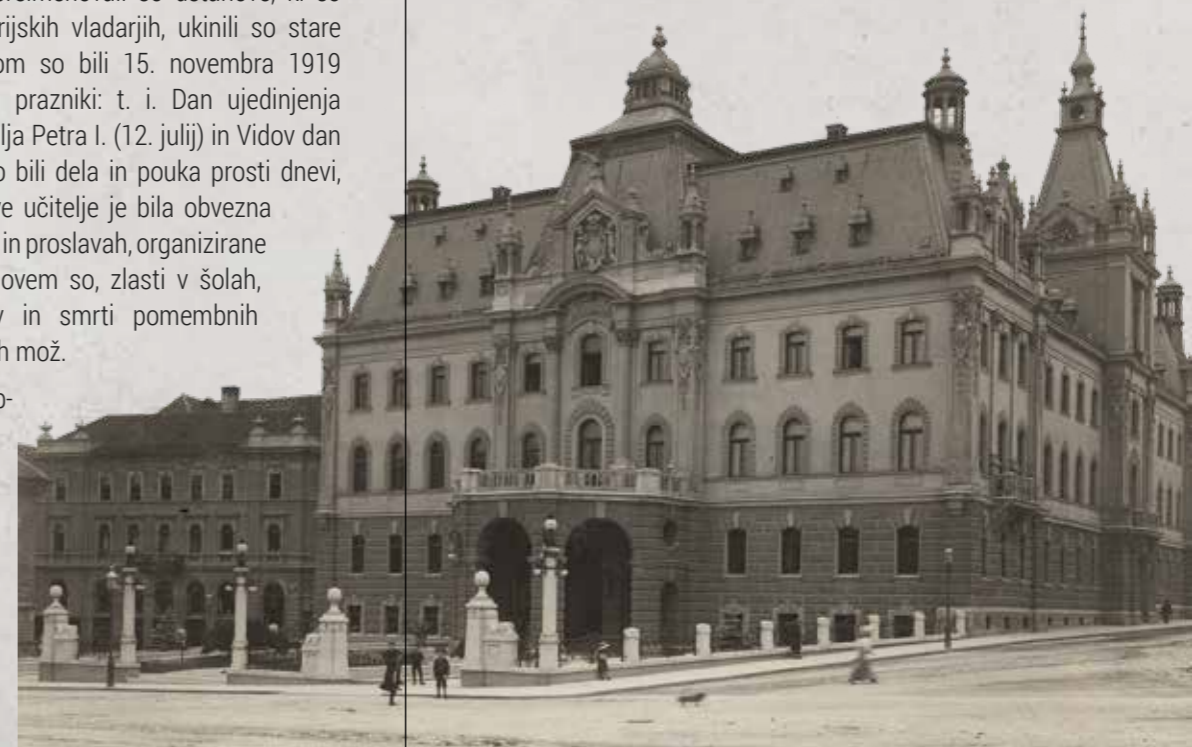
Poslopje Univerze v Ljubljani, ustanovljene leta 1919. (SI_ZAL_LJU/0342, Zbirka fotografij, A01-027)

Aleksander Karađorđević, srbski regent že od leta 1914, se je konec junija 1920 podal na prvi uradni obisk hrvaških in slovenskih krajev, ki so ga z veliko pozornostjo in naklonjenostjo spremljali takratni časopisi. Najprej