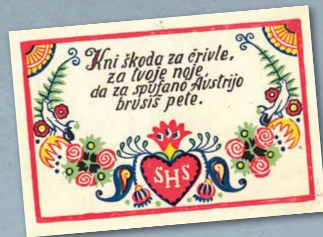
Plebiscitna razglednica z geslom Kni škoda za črville, za tvoje noje, da za spufano Avstrijo brusiš pete, je opozarjala na zadolženost Avstrije po vojni.